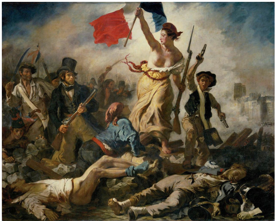
Eugène Delacroix; La libertad guiando al pueblo; 1830

Todos los cambios anteriores sumado a los descontentos, condujo a que los artistas comenzaran a sentirse